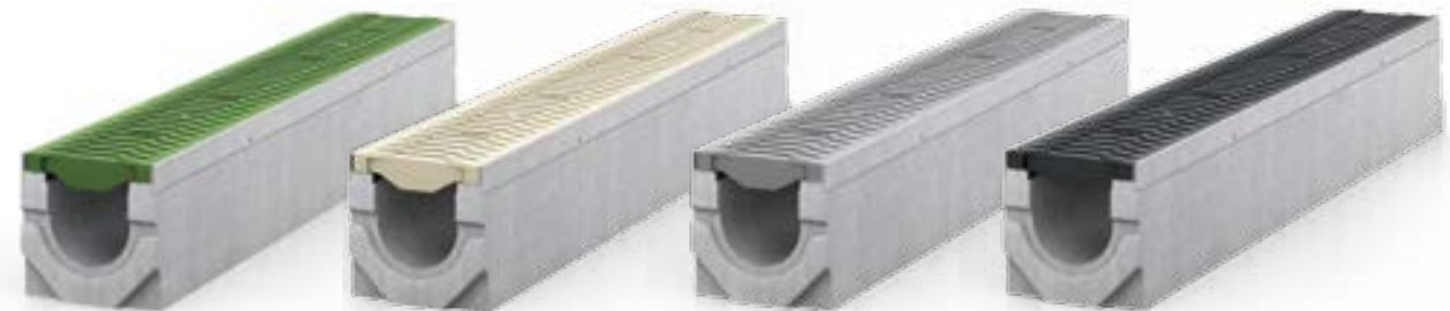
FASERFIX®KS 100 con rejilla FIBRETEC® en color Fern