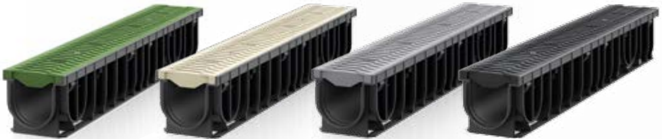
RECYFIX®PRO 100 con rejilla FIBRETEC® en color Fern